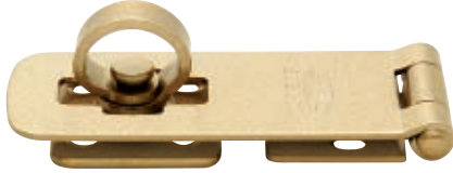
FG-70mm ステンレス製・ゴールド