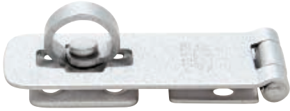
FS-70mm ステンレス製・シルバー