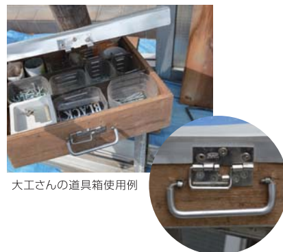
大工さんの道具箱使用例